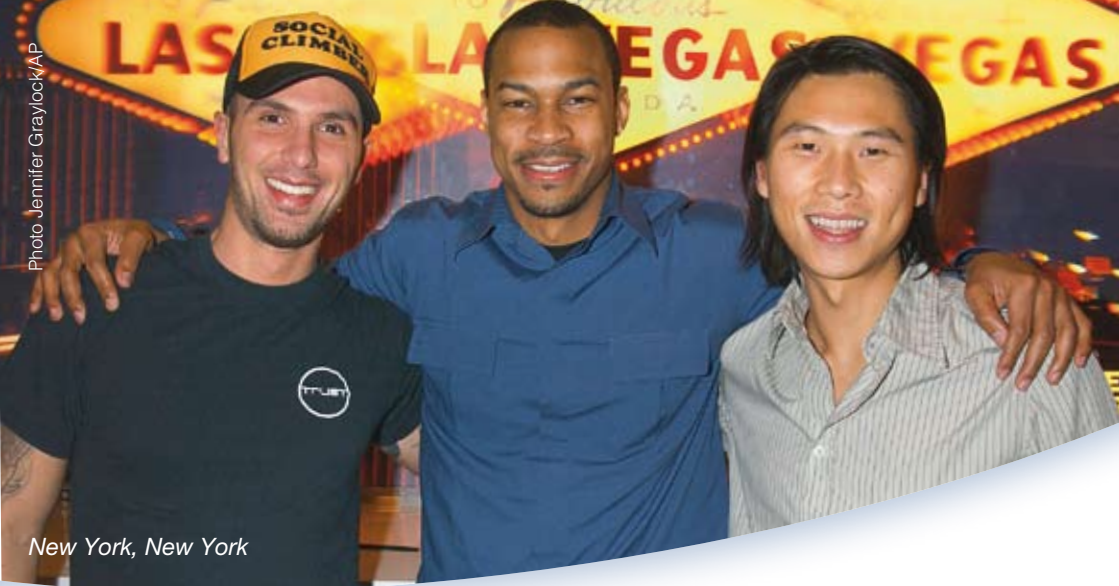
New York, New York