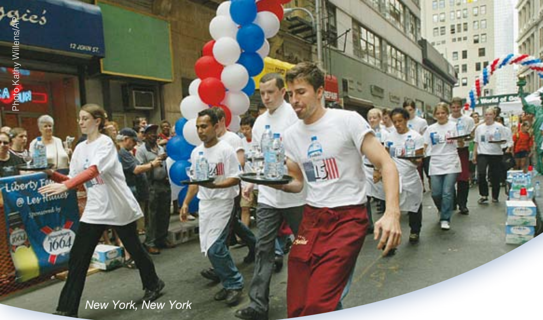
New York, New York