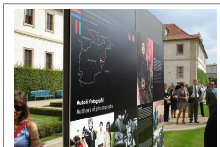
Informační tabule výstavy v zahradě Senátu

Fotografie zobrazující práci českého Provinčního rekonstrukčního týmu v afghánské provincii Lógar jsou od 18. srpna k vidění v zahradě českého Senátu. Čeští experti se v Afghánistánu zaměřují hlavně na pomoc v zemědělství, školství a zdravotnictví. „Jsem rád, že Senát nabízí veřejnosti tento soubor fotografií, který popisuje náročnou a málo známou práci Čechů v Afghánistánu. Spolu s rekonstrukčním týmem tam působí i naši vojáci a pokračují tak v nejlepších tradicích našeho vojenství,“ řekl po otevření výstavy předseda Senátu Přemysl Sobotka. Zahájení výstavy se zúčastnili i ministři zahraničí a obrany Jan Kohout a Martin Barták, afghánský velvyslanec v České republice