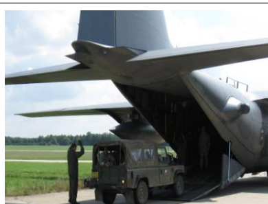
Zkouška nakládky dřívku na bechyňské základně

Čeští parašutisté ze 43. výsadkového praporu z Chrudimi a jejich kolegové z coloradské Národní gardy se tři týdny na přelomu července a srpna účastnili společného cvičení ve vojenském újezdu Boletice na jihu Čech. Součástí výcviku byly i denní a noční seskoky z transportního letadla C-130 Hercules na základně poblíž města Bechyně. „S výcvikem jsme naprosto spokojeni, vyhovovalo nám i