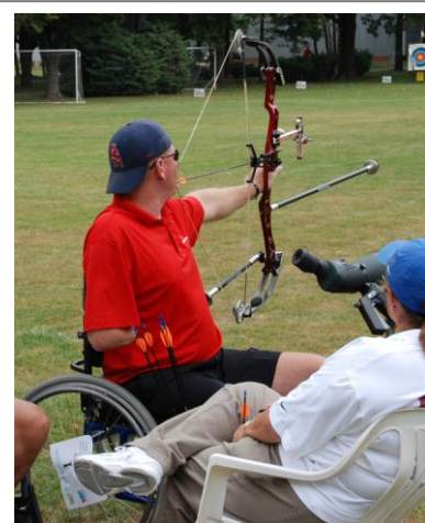
Člen amerického týmu při přípravě na závod

Výprava 17 amerických atletů vybojovala na 7. paralympijského mistrovství světa v lukostřelbě ve středočeském Nymburku tři medaile – jednu stříbrnou a dvě bronzové. Do soutěže, která se konala od 14. do 23. srpna, se celkem přihlásilo 188 střelců a 110 členů doprovodu z 35 států. Závodilo se v nymburském Sportovním centru, kde se připravují i čeští vrcholoví sportovci. Šampionát podpořilo také Velvyslanectví USA a kulturní atašé David Gainer dekoval vítěze. Organizátorem soutěže byl tradiční pořadatel významných akcí jak pro handicapované sportovce, tak i nepostižené: SK Nové Město nad Metují.