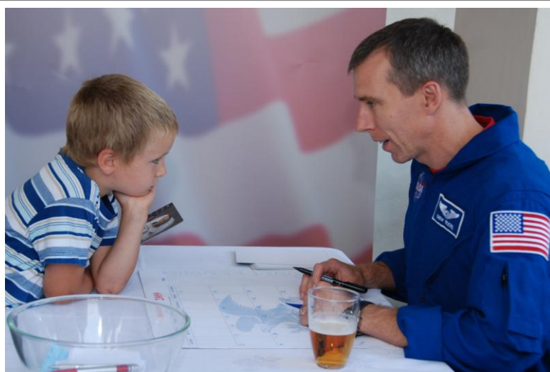
Astronaut Andrew Feustel se v Praze podepisuje svým fanouškům