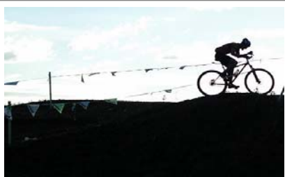
Terénní cyklistika je v Česku čím dál populárnější. Podle Van Abela pravý boom teprve přijde.

Ředitel největší světové organizace terénních cyklistů IMBA se sídlem v USA Mike Van Abel se koncem května zúčastnil v Jizerských horách příprav založení prvního českého 'singletreku', sítě trvale udržitelných stezek pro terénní cyklistiku. Lesní pěšiny určené pro horská kola mají podle svých tvůrců narozdíl od asfaltových cest minimální dopad na okolní přírodu a jsou bezpečné, protože nedovolují jet příliš rychle. Mohou se tak na ně vydat jak rodiny s dětmi, tak zkušení cyklisté. Van Abel, který má se stavbou těchto stezek zkušenosti ve svém domovském