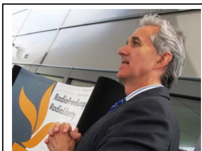
Prezident RFE mluví o potenciálu demokracie

Rádio Svobodná Evropa / Rádio Svoboda (RFE/RL) slavnostně otevřelo v úterý 12. května své nové supermoderní sídlo na pražském Hagiboru. Na 500 zaměstnanců stanice se sem začalo stěhovat před šesti měsíci, první pořad vysílalo už na počátku letošního února Rádio Free Iraq. „Tohle není jen nová centrála Rádia