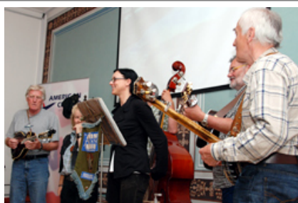
Country kapela Paběrky v Americkém centru