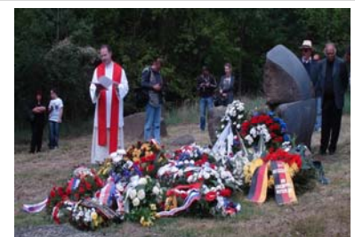
Více lidí než dříve přišlo letos uctít romské oběti 2. světové války