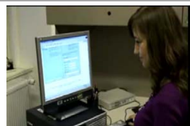
Navigating the ESTA website

Už více než dva měsíce mohou Češi cestovat bez víz jako turisté nebo na krátkou pracovní cestu do Spojených států a využít tak Elektronický systém cestovní autorizace (ESTA), jejich pobyt ale nesmí přesáhnout 90 dní. Jak uvedl generální konzul Stuart Hatcher, o registraci ESTA požádalo od 17. listopadu 2008, kdy byl systém pro Čechy zaveden, více než šest tisíc lidí. „Je to dvakrát více, než bylo žádostí o vízum za stejné období o rok dříve, uvedl Hatcher.“ Generální konzul považuje nový systém za obrovský úspěch a dokládá to informací, že „skoro všechny žádosti o registraci jsou vyřízeny kladně, v naprosté většině obratem.“ Americké úřady zatím nezaznamenaly s fungováním systému žádné výraznější problémy. Výjimečně se vyskytly případy, kdy si lidé cestující do USA s registrací ESTA zapomněli ověřit, zda mají biometrický pas, který české úřady vydávají od září 2006. Američtí imigrační úředníci neumožnili vstup na