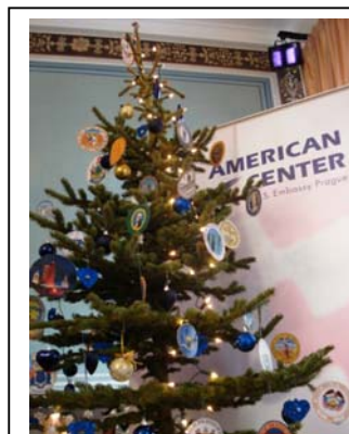
Vánoční strom s ozdobami reprezentujícími 50 států americké unie v Americkém centru

Americké centrum (AC) oslavilo letošní Vánoce už 18. prosince velkou párty. Mezi nejzajímavější hosty patřil