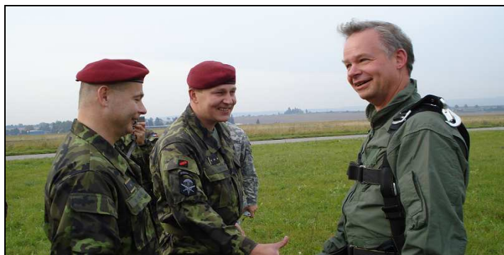
Velvyslanec se zdraví s českými vojáky po seskoku v Prostějově

pohádkové město Jičín, jehož je nyní čestným občanem. Se studenty místního gymnázia hovořil o možnostech studií ve Spojených státech, prohlédl si historické náměstí postavené Albrechtem z Valdštejna a zavítal i do česko-americké společnosti zabývající se produkty pro zubní ordinace.