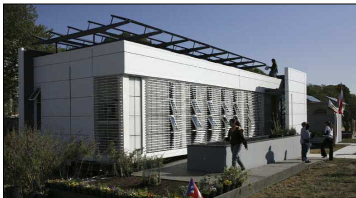
Česká televize přinesla reportáž o veletrhu obnovitelných technologií, který se konal ve Washingtonu

Obchodní mise šesti amerických firem navštívila 17. října Prahu, aby svým pražským partnerům představila nejnovější technologie v oblasti obnovitelných zdrojů a také navázala nové obchodní vztahy. Dvanáct českých firem a představitelé ministerstva zemědělství a České energetické agentury se zúčastnilo setkání v Americkém centru. O několik dní později zástupci společnosti Plymouth Tube Company podepsali kontrakt s českou energetickou firmou, která by se mohla stát jejím distributorem.