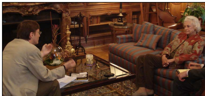
Soudkyně O'Connor mluví s reportérem z Hospodářských novin