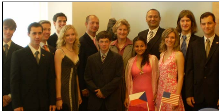
Hughes s Mladými ambasadory v Americkém centru v Plzni

11. – 13. června byla v Česku náměstkyně ministryně zahraničí po veřejnou diplomacii Karen Hughesová. Zúčastnila se zasedání Rady guvernérů pro rozhlasové a televizní vysílání, která dohlíží na práci Rádia Svobodná Evropa. V Plzni se setkala s absolventy programu Mladí ambasadoři a prohlédla si pivovar Pilsner Urquell. V interview pro Lidové noviny hovořila o roli USA ve světě, o “vedení” míru proti teroristické ideologii a o významu svobody a demokracie, jak o nich mluvil ve svém projevu v Praze prezident Bush.