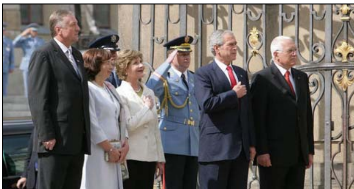
Oficiální přivítání prezidenta Bushe na Pražském hradě

“ Svoboda je nejlepší způsob, jak popustit uzdu kreativitě a ekonomickému potenciálu každého národa. Svoboda je jediné společenské uspořádání, které vede ke spravedlnosti. A lidská svoboda je jedinou cestou, jak se domoci lidských práv.... Nejúčinnější zbraní v boji proti extremismu nejsou kulky ani bomby - nýbrž univerzální přitažlivost svobody. Svoboda je výtvozem našeho stvořitele a předmětem tužby každé duše. ” (Prezident Bush, Praha, 5. června)