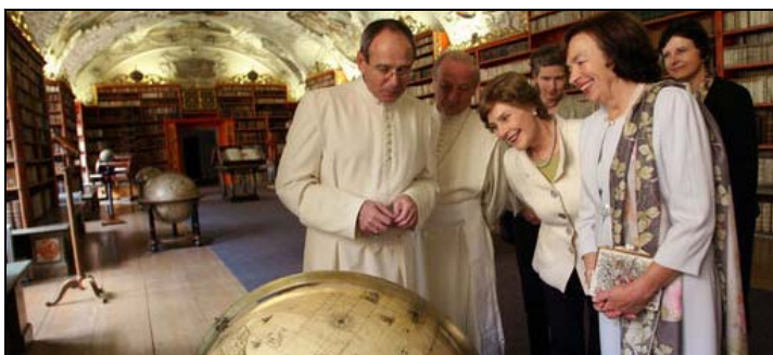
Laura Bushová a Livia Klausová ve Strahovském klášteře

4. a 5. června navštívil Českou republiku americký prezident George Bush se svou manželkou Laurou. Praha byla první zastávkou na jejich evropské cestě, která také zahrnovala summit zemí G8 v německém Heiligendammu, Polsko, Itálii, Albánii a Bulharsko. Bush se sešel se svým českým protějškem Václavem Klausem, premiérem Mirkem Topolánkem a dalšími českými představiteli. Jednáním dominovala protiraketová obrana a otázka víz do USA. Na konferenci “Demokracie a bezpečnost” Bush zdůraznil, jak si Amerika váží úsilí politických disidentů z celého světa bojovat za svobodu.