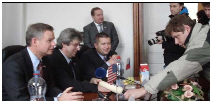
Velvyslanec Graber a starosta Řihák hovoří v Příbrami s novináři

Velvyslanec Richard Graber se v únoru sešel v Praze a v Příbrami se starosty obcí z okolí vojenského újezdu Brdy. Otevřel tak dialog o radarovém zařízení protiraketové obrany, o jehož umístění v oblasti se jedná. Velvyslanec uvedl upřesňující informace o typu uvážovaného radaru a o jeho vlivu na životní prostředí a zdraví obyvatel. Během diskuze Graber starostům přislíbil, že jejich obavy se budou řešit. "Jsme teprve na začátku," řekl a dodal, že do regionu přijede na výlet se svou rodinou.