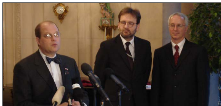
Zleva Paul Rosenzweig, Martin Povejšil z ministerstva zahraničí a zástupce amerického velvyslance Cameron Munter.

Tajemník pro zahraniční záležitosti ministra pro vnitřní bezpečnost USA Paul Rosenzweig hovořil 24. ledna v Praze o změnách v bezvízovém styku s představiteli 13 zemí včetně České republiky, které jsou na tzv. cestovní mapě. Na této konferenci, pořádané ve spolupráci s českým ministerstvem zahraničních věcí, popsal Rosenzweig postup vlády USA a jejích právních expertů při vypracování nové legislativy vízové politiky, která by umožnila vstup dalších států do Programu bezvízového styku. "Toto je první krok na dlouhé cestě – ale osobně domnívám, že můžeme uspět ještě do konce volebního období prezidenta Bushe," řekl Rosenzweig po setkání s vysokými českými představiteli. Rosenzweig také navštívil pražské letiště a tiskárnu cestovních pasů a ocenil jejich bezpečnostní opatření.